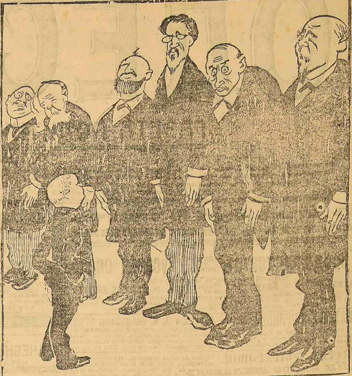
Гимназист (членом родительского комитета) — директору велит сказать влад, что сегодня родительских занятий не будет.