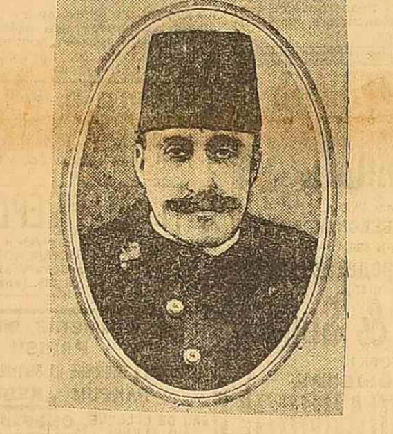
Наскандив турецкого престола Юсуф-Иззет.

За-границей. Триполитский конфликт. В Константинополе.