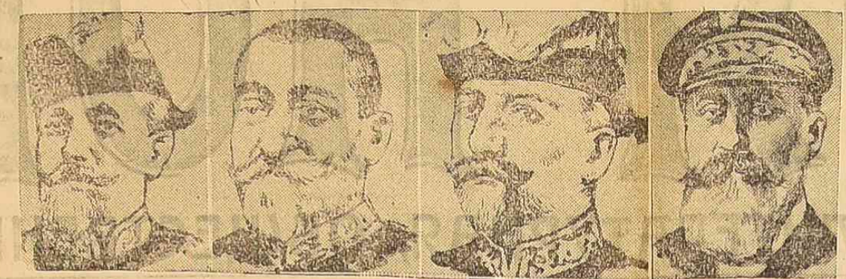
Виде-Ам. Вун-де-Ле-Висе-ам. Жюзе-Ваньер, Виде-Ам. Оберг, де-Аппе-Ам. Базе, командир флота, командир гвардейского эскадрона 2-ой линейной эскадры. Французскими морскими силами.