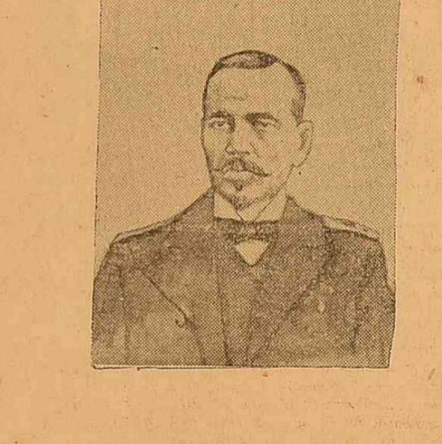
Контръ-адмиралъ М. В. Бубновъ, названченій товарищемъ морса, министра.