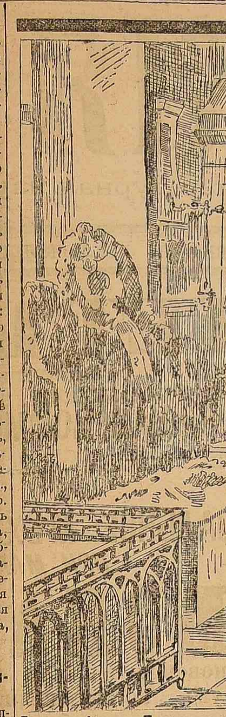
Внутренний вид Петропавловского собора. Успенский храм Русских Царей.

Правительственные распоряжения. Высочайший приказ по военному ведомству.