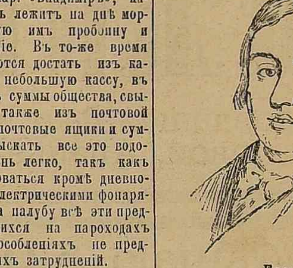
Сотзей и Корндрич.