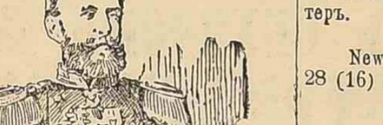
Висе-адмирал Н. И. Назанов