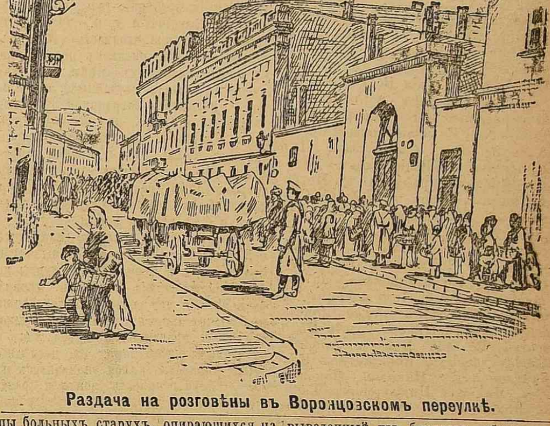
Раздача на розговѣны въ Воронцовскомъ переулкѣ.