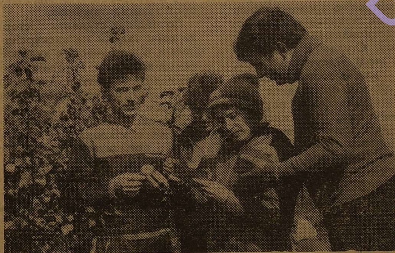
Студенти Одеського сільськогосподарського інституту теоретичні знання закріплюють на практичних заняттях на колгоспному полі.