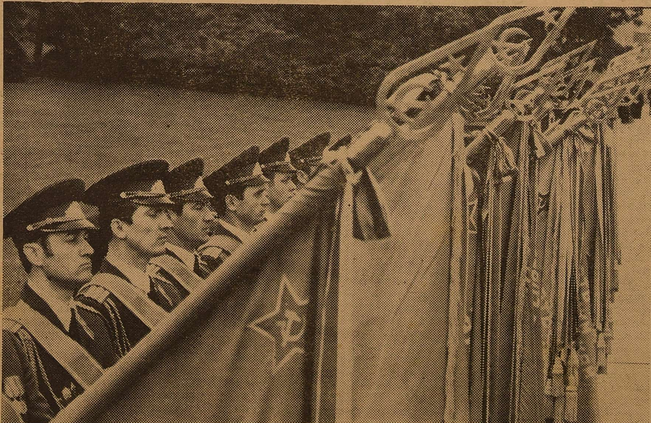
Воїни восьмидесятих годов склоняют боевые знамена у могилы Неизвестного солдата у Кремлевской стены.

Історичним, політичним підсумком другої світової війни і її складової частини — Великої Вітчизняної війни нашого народу — є зміцнення позицій соціалізму, посилення його впливу на світовій арені, ослаблення і зрушення сфери панування імперіалізму. Проте ослаблення позицій імперіалізму не змінило його природи, не знизило, а ще більше посилює його агресивність. У 80-х роках загострилася міжнародна обстановка. Імперіалістичній політиці милітаризму і агресії Радянський Союз, інші країни соціалізму протипоставляють політику миру, зміцнення безпеки, відвернення ядерної війни.