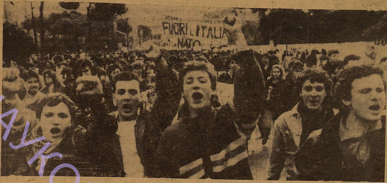
РИМ. В столице Италии проходят массовые антиамериканские демонстрации. Молодые итальянцы решительно требуют от Соединенных Штатов прекратить акты агрессии против Ливии.

С тревогой узнал я утром из сообщений радио, что наихудшие опасения подтвердились: США начали свою агрессию против Ливии бомбардировкой ее городов и сел, совершенно не считаясь с мнением миролюбивой общественности и даже своих западноевропейских союзников. Примечателен тот факт, что в результате налета американских истребителей пострадало здание французского посольства. Я, как и все советские молодые люди, верю, что ливийский народ даст достой-