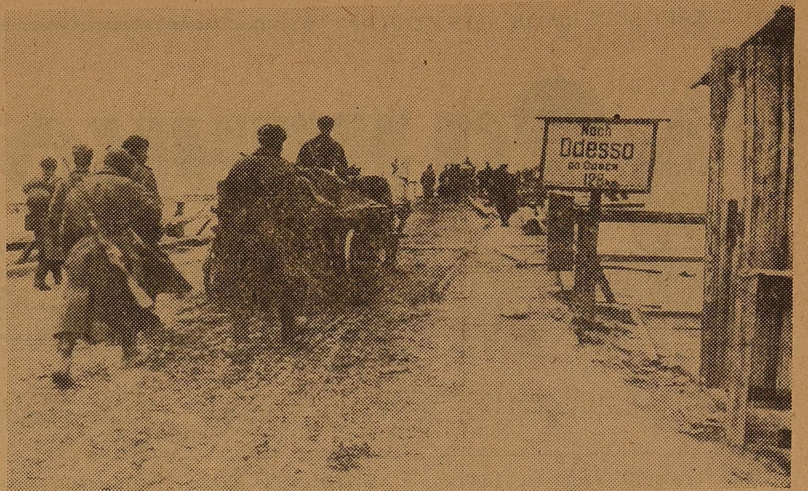
ЦІ ЗНІМКИ БУЛО ЗРОБЛЕНО У КВІТНІ 1944 Р. РАДЯНСЬКИМИ ФОТОКОРЕСПОНДЕНТАМИ.