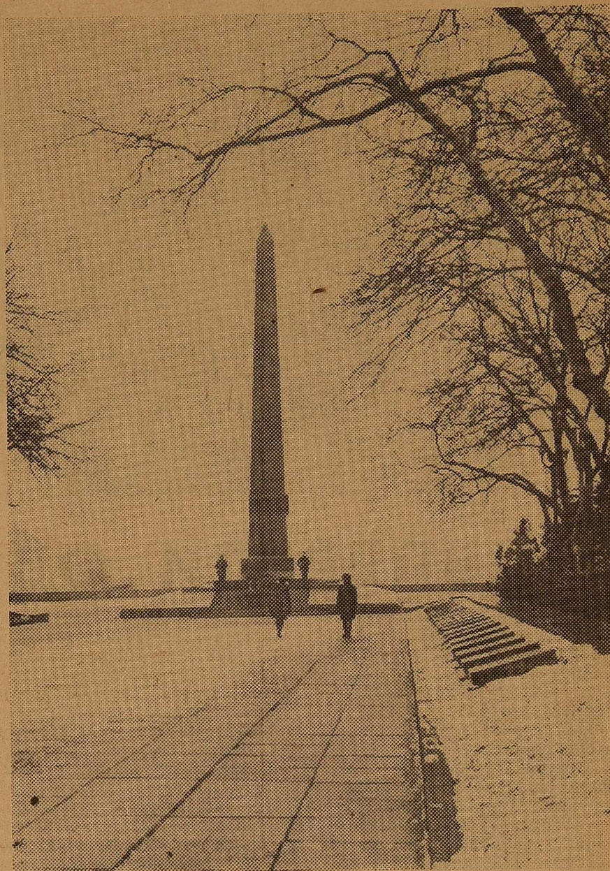
ОДЕСА ПАМ'ЯТАЄ ВАС