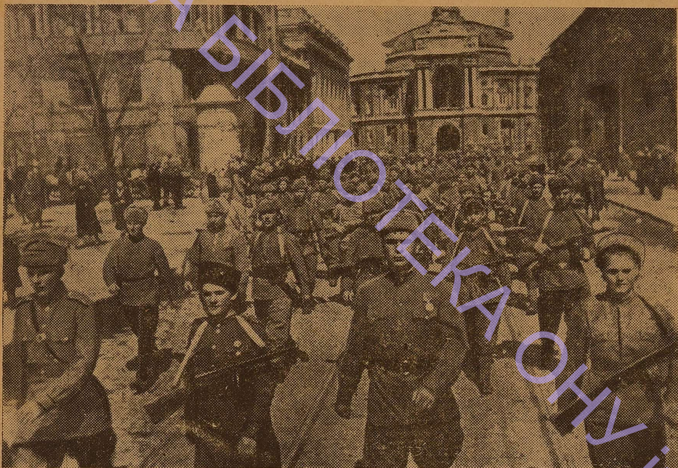
СЛАВА ВАМ, ВИЗВОЛИТЕЛІ!

Видається з 1933 р. 13 (1546). 6 КВІТНЯ 1984 РОКУ. Виходить щотижня. Ціна 2 коп.