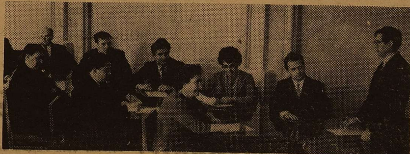
На знімку: засідання Вченої ради механіко-математичного факультету (1965 рік).

Набагато розширилась наукова робота на факультеті, урізноманітнілась її тематика. Набагато більше стало тем, пов'язаних з виробництвом, обсяг робіт виріс за останні п'ятнадцять років більше ніж в десять разів.