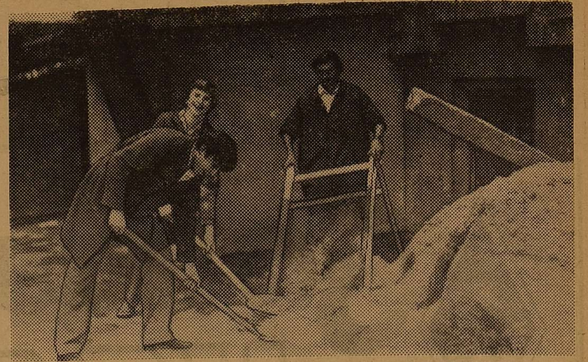
Великий обсяг робіт в дні літніх канікул виконали студенти фізичного факультету.

На знімку: спортивна робота у студентів-фізиків.