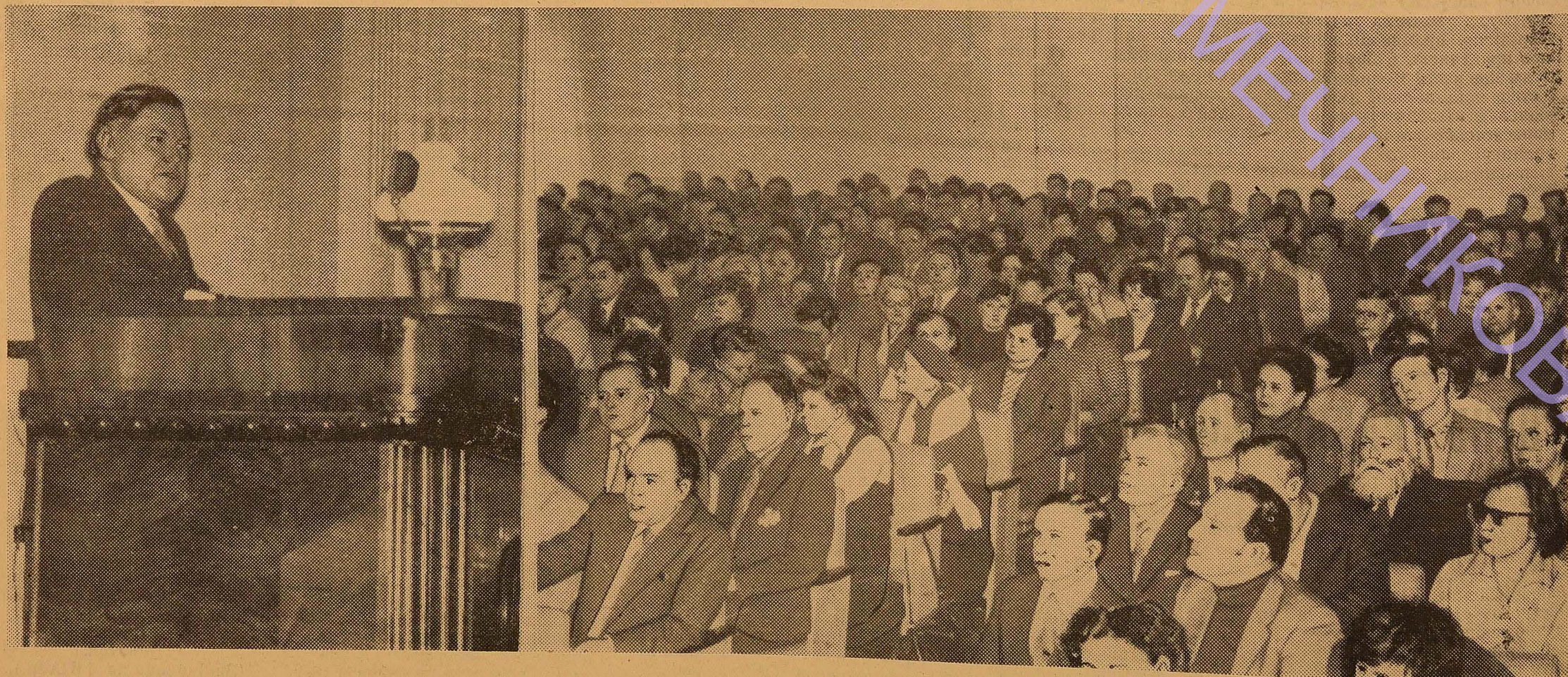
Великий актовий зал. Йдуть збори партійного активу університету. Виступає делегат XXVI з'їзду КПРС, член ЦК КПРС, перший секретар Одеського обкому Компартії України тов. М. К. КИРИЧЕНКО.

Активізація цієї роботи тим більш важлива, підкреслив М. К. Кириченко, що університет повинен готувати наукові кадри не тільки для себе, а й для інших вузів, насамперед спеціалістів з фундаментальних наук. Сучасний рівень наукової інформації, зросли вимоги до спеціалістів з університетською освітою вимагають принципово нового підходу до організації навчального процесу і самостійної роботи студентів. Тут слід ширше використовувати наявний досвід інших університетів республіки і країни, краще застосовувати в учбовому процесі технічні засоби навчання, а також більш предметно і цілеспрямовано займатися розробкою і введенням в учбовий процес спецкурсів. Як показує практика, спецкурси, поєднані з різноманітними спецсеминарами, забезпечують різнобічну і більш поглиблену підготовку студентів.