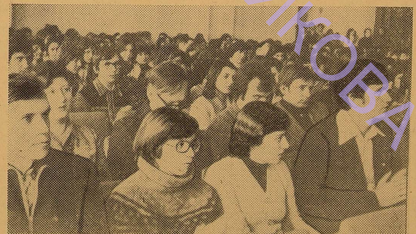
На знімках: під час мітингу на механіко-математичному факультеті.