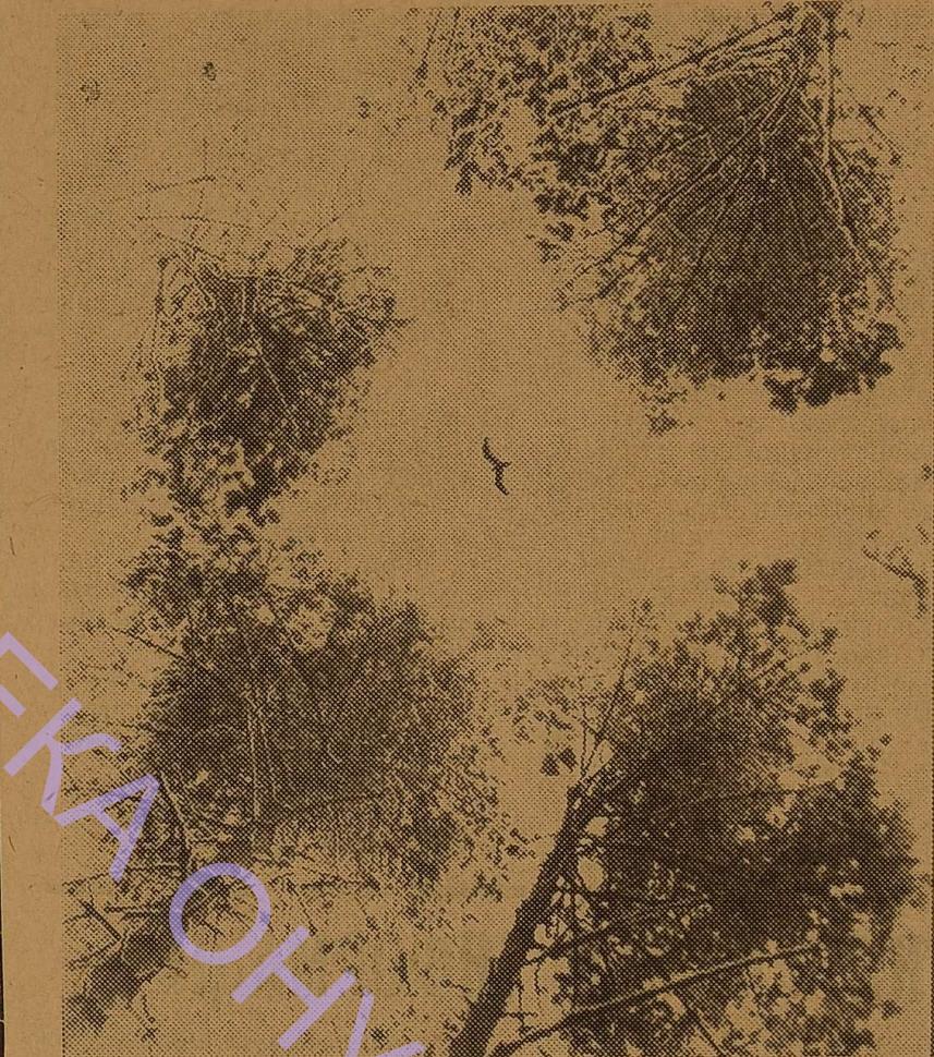
В чистому небі.