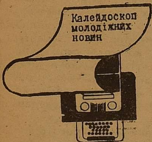
Калейдоскоп молодіжних новин