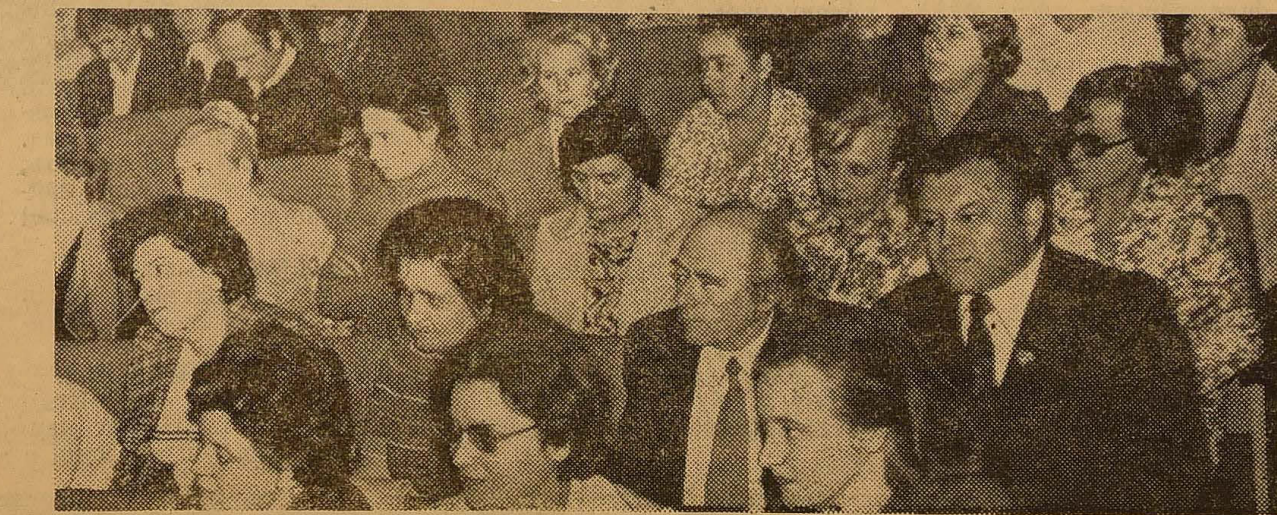
Іде підсумкова конференція.

Партком і партійні організації факультетів систематично контролювали хід навчання. Питання про роботу партійної організації університету по виконанню Постанови ЦК КПРС «Про завдання партійної освіти у світлі рішень XXV з'їзду КПРС» було обговорено на партійних зборах університету. Факультетські партійні організації також протягом року обговорили це питання. Завдання зараз полягає в