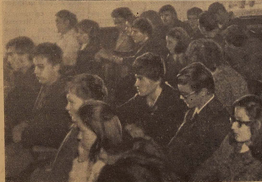
Идуть звітно-виборчі комсомольські збори фізичного факультету.