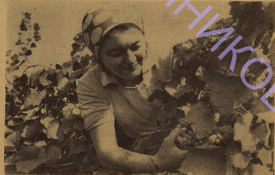
Одна за одною від гарману колгоспу «50 років Вели- кого Жовтня» Іванівського району відходять автомашини, наповнені насінням соняшника.