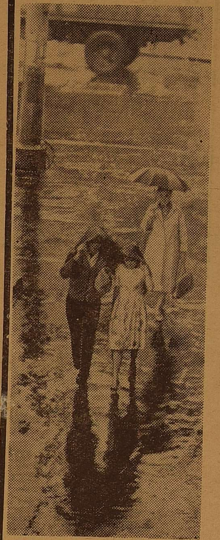
Осінь в Одесі.