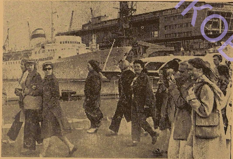
Наші гості — студенти і викладачі Латвійського держуніверситету — на Одеському морському вокзалі. На прийомі у кабінеті ректора виступає проректор Латвійського держуніверситету.

Народний хор Латвійського держуніверситету дав більше 900 концертів, виступаючи перед