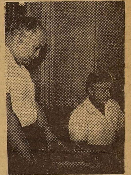
Виступає ректор. Учасники зустрічі — викладачі і вихованці.

Фото з зустрічі за «круглим столом» К. Чекиної.