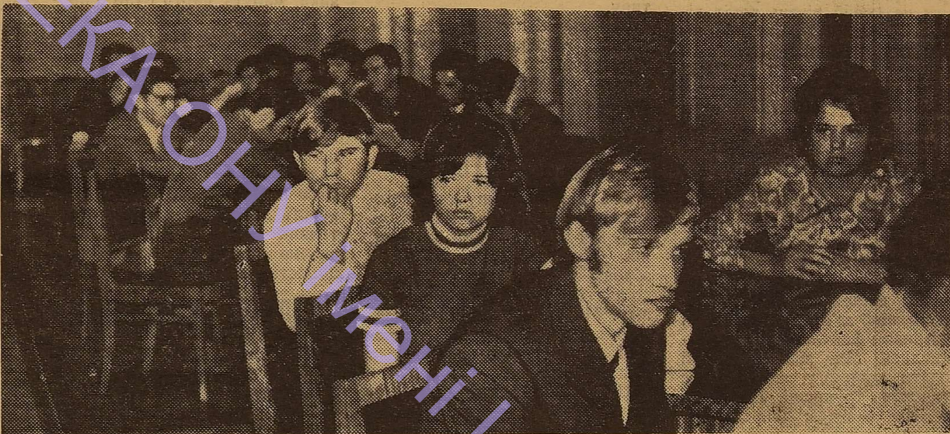
Середа. У конференц-залі. Учасники зустрічі за «Круглим столом».