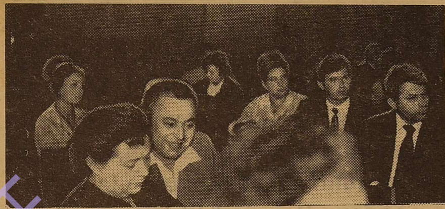
Учасники зустрічі — викладачі і вихованці.