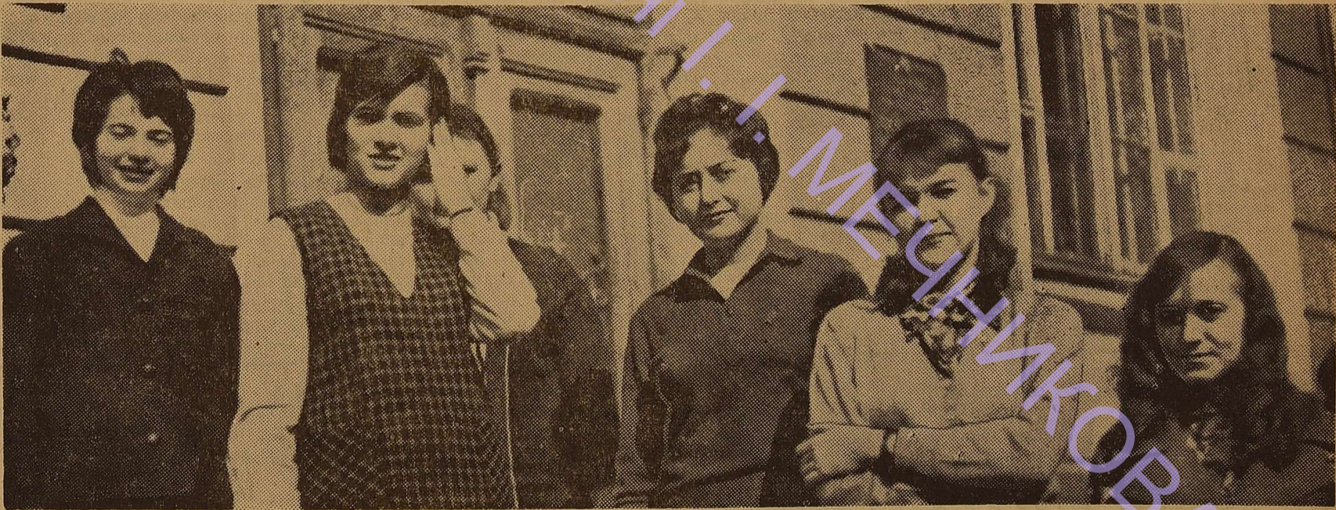
На цьому фото — дівчата мехмату, яких зняв напередодні 8 Березня університетський фотохудожник В. Шишин.

Звіт про засідання вченої ради буде надруковано в наступному номері.