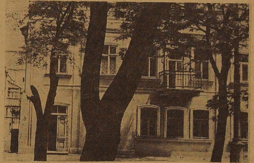
Будинок № 21 по вулиці Челюскінців, в якому зупинялася Леся Українка в час перебування в Одесі. На другому поверсі — балкон — квартира Сидоренків.

Наприкінці лютого в Будинку вчених відбудеться наукова сесія семінару педагогів-філологів, який працює тут під керівництвом проф. А. В. Недзвідського. Серед доповідачів чимало вчителів з периферії.