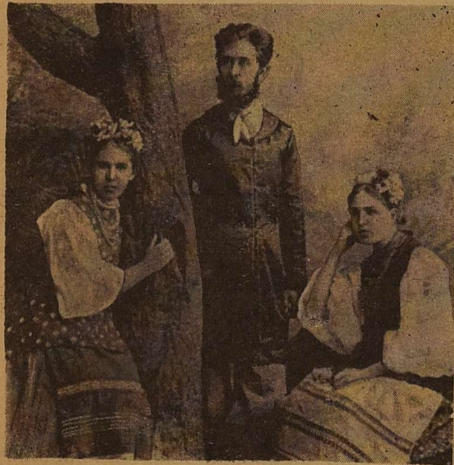
Леся Українка з братом Михайлом і Маргаритою Комаровою. Одеса. 1889 р.

СПАДЩИНА Лесі Українки, як і спадщина її попередників та сучасників — Тараса Шевченка, Івана Франка, Михайла Коцюбинського, з року в рік залишаються в центрі уваги молодих дослідників, дипломників філологічного факультету. Тільки за останні два роки дістали схвальні відгуки рецензентів і державних комісій дванадцять дипломних робіт, присвячених творчості Лесі Українки. Тематика і проблематика досліджень