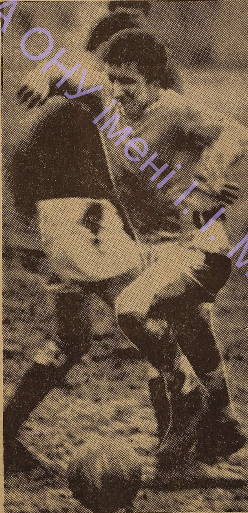
НА КОНКУРС СТУДЕНТСЬКІ БУДНІ.

Третій трудовий. Зліва — «Тут в туфлях не пройдеш», справа — «Прорив».