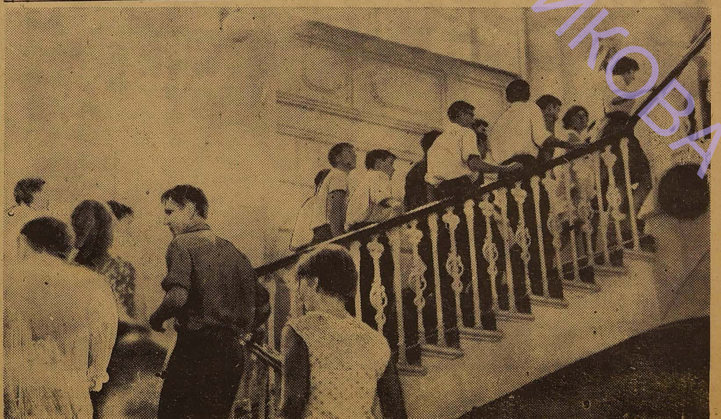
Це фото зроблено 30 серпня 1969 року. Студенти-першокурсники крокують у великий актовий зал на свої перші вузівські збори.

Партком вирішив на сторінках газети «За наукові кадри» вести «ДОШКУ ПОШАНИ», до якої заноситимуться студенти і групи, які відзначаються на польових роботах.