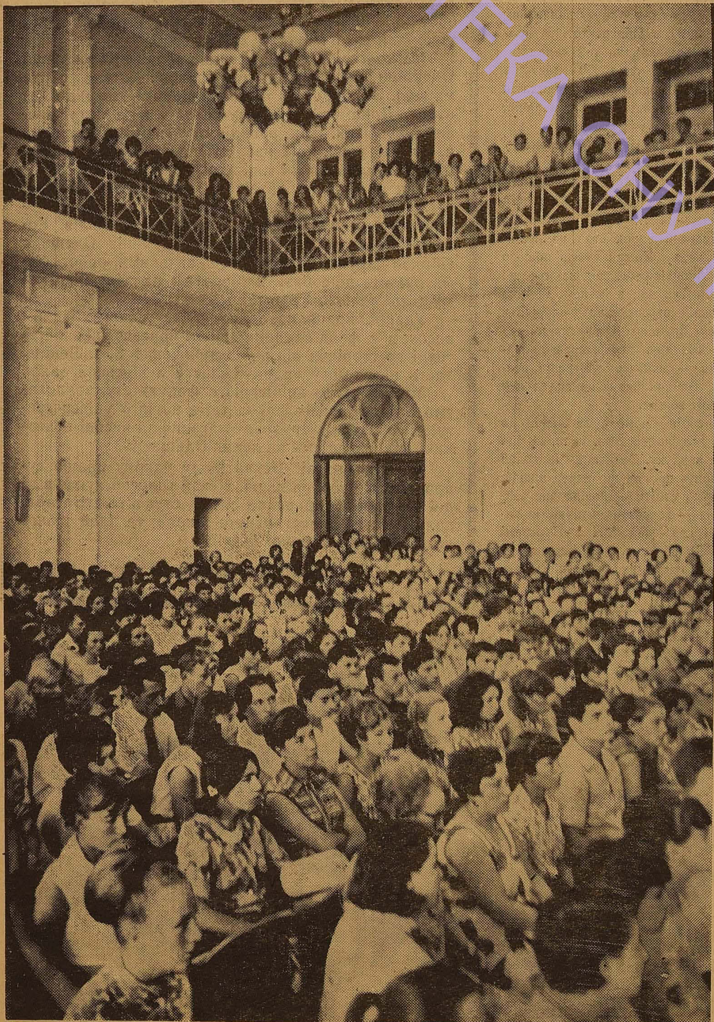
Великий актовий зал 30 серпня 1969 року. Вступники ювілейного ленінського року на зустрічі з ректором та вченими університету.

Н. К. Крупська на питання про історію походження псевдоніма Володимира Ілліча «Н. Ленин» писала: «Уважаемые товарищи! Я не знаю почему Владимир Ильич взял себе псевдоним «Ленин», никогда его об этом не спраши-