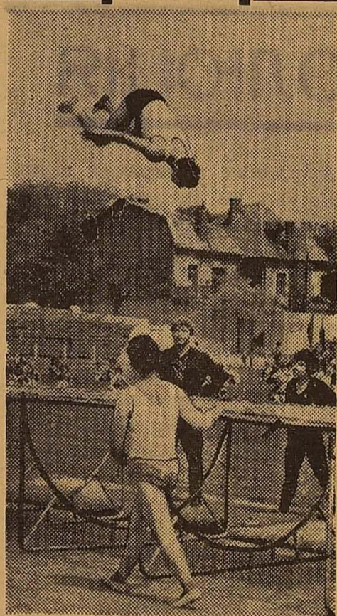
Виконуються вправи на батуді.