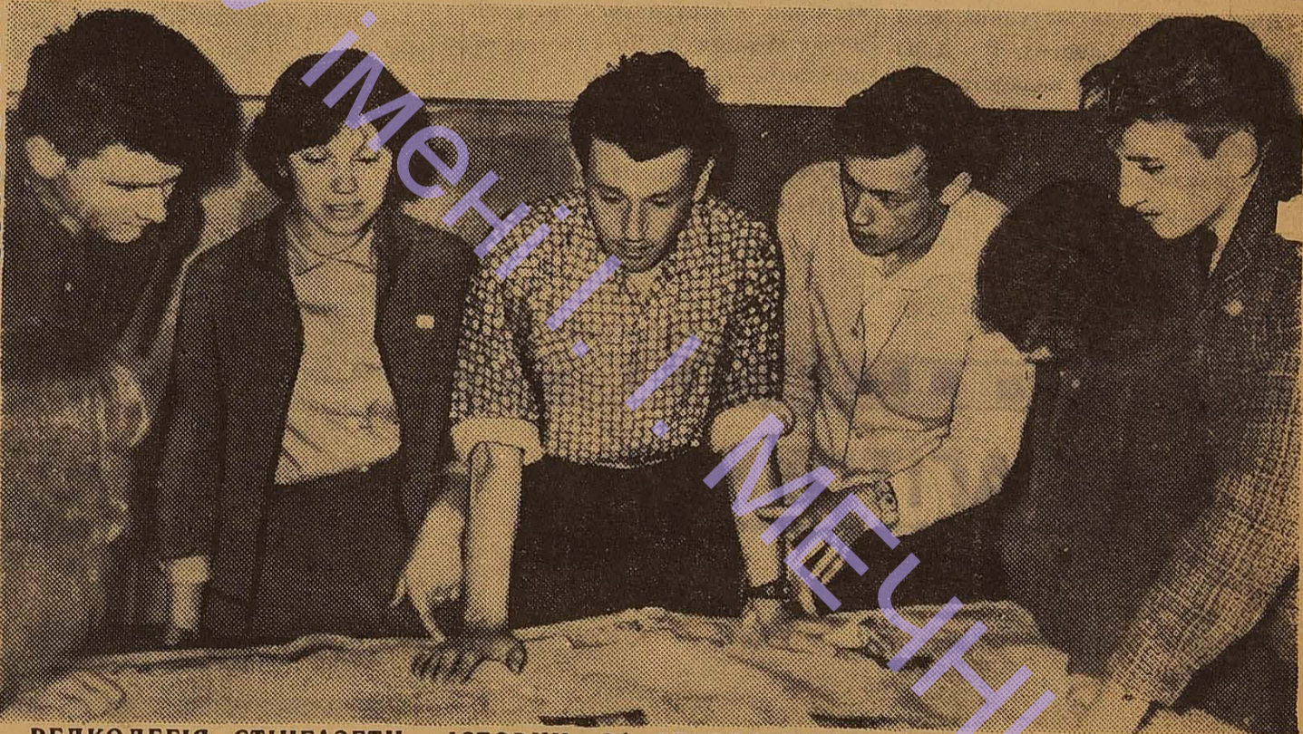
РЕДКОЛЕГІЯ СТИНГАЗЕТИ «ІСТОРИК» ЗА ОБГОВОРЕННЯМ ЧЕРГОВОГО НОМЕРА.

Рішення журі затверджено на засіданні парткому.