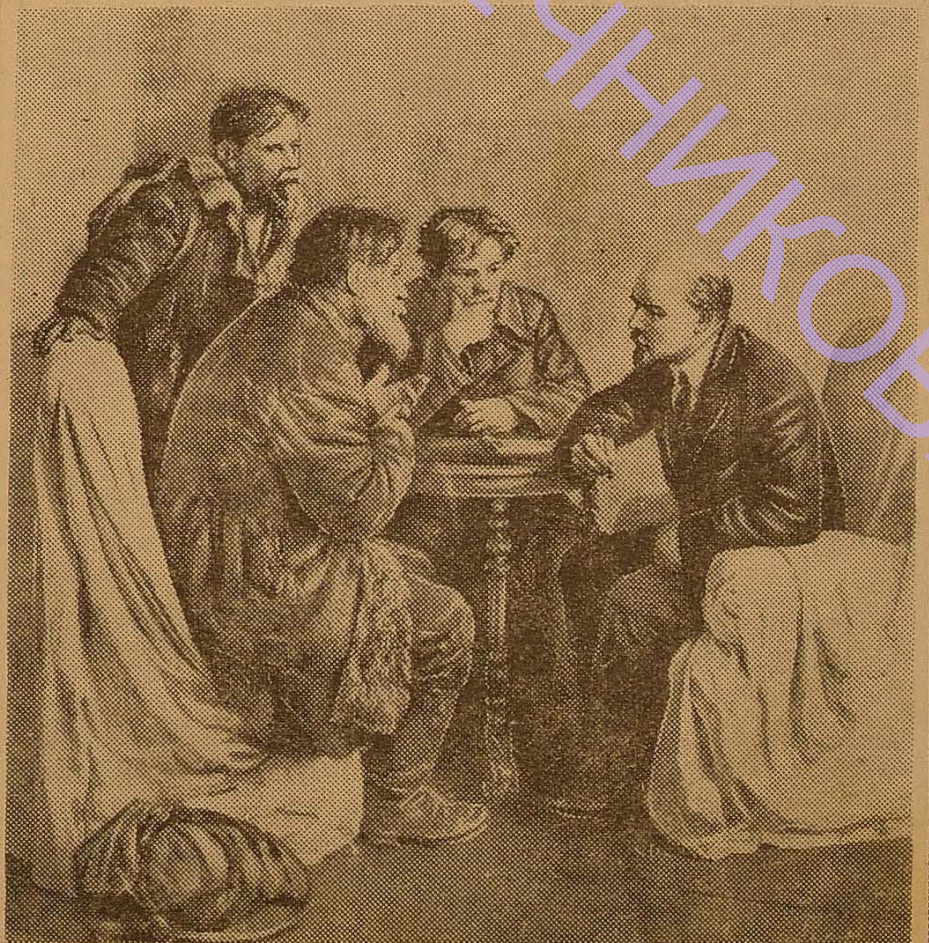
Ходаки у В. І. Леніна.

Пленум пройшов активно, в діловій обстановці.