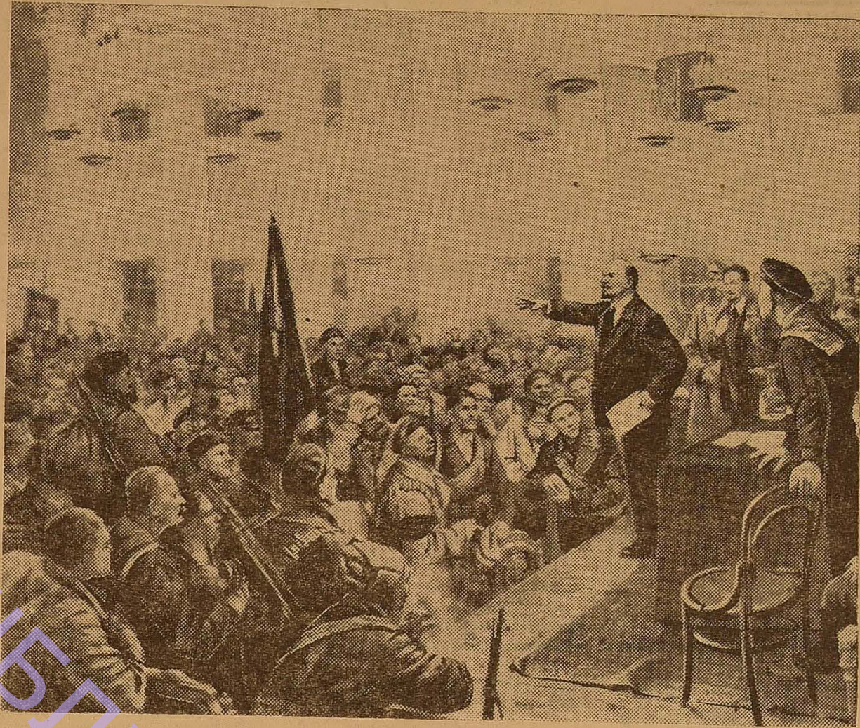
Виступ В. І. Леніна на II Всеросійському з'їзді Рад.

Так, наприклад, в картині «Зимовий взято» зображено внутрішні приміщення Зимового палацу після його штурму в ніч з 7 на 8 листопада 1917 року. Перед ганком Йорданських сходів, прикрашених скульптурою, позолотою, розкішними бронзовими канделябрами, стоять двоє озброєних людей. Вони поставлені тут для охорони колишнього оплоту царизму і Тимчасового уряду. Один — робітник-червоноармієць, зодягнений у шкіряну куртку з червоною пов'язкою на рукаві. Весь його вигляд говорить про підтягнутість, волю зібраність, силу і мужність. Зосереджене обличчя виражає розум, впевненість, волю. Другий — літній солдат, простий російський селянин, зодягнений у солдатську шинель. Зморшкувате, покрите густою бородою обличчя, приружені з хитринкою очі, напружені руки землероба, впевнений жест руки, що тримає гвинтівку, фляжка на боці характеризують бувалого солдата, який пройшов важку школу