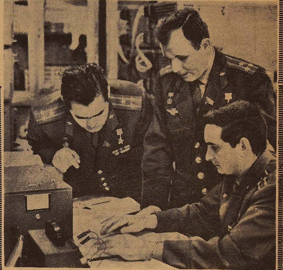
НА ЗНІМКУ: космонавти (зліва направо) Андріан Ніколаєв, Юрій Гагарін і Валерій Биковський рішають задачі по визначенню параметрів руху ракети.

Космічні трудівники Країни Рад живуть напруженим трудовим життям, основна мета якого — нові космічні польоти. Вони вивчають і відробляють нагромаджений матеріал, удосконалюють теоретичні й практичні знання. Космічні студенти навчаються в стінах Академії імені Жуковського — кузні авіаційних кадрів.