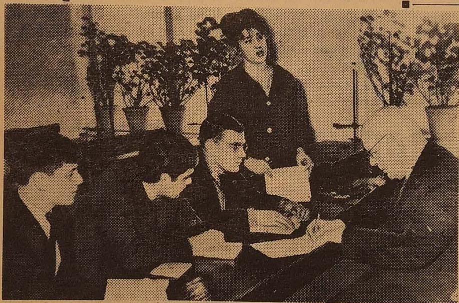
ІДЕ РОЗБІР УРОКУ.