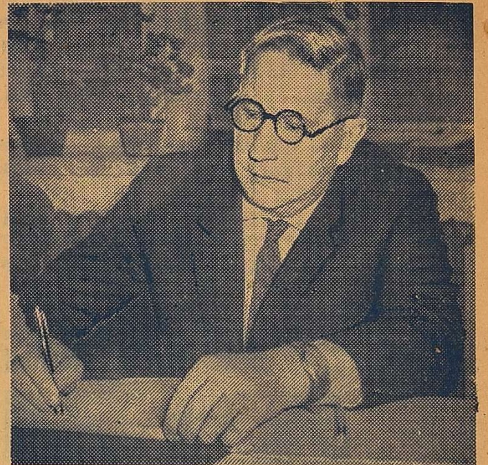
ПРОФЕСОР О. О. МОРОЗОВ.

Наші плани на 1966 рік? Вони такі: не знижувати досягнутих масштабів і темпів, розвивати далі цю дуже потрібну справу, що відповідає духові часу.