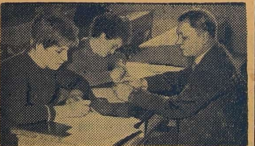
ПІД ЧАС ІСПИТІВ.

С ЕСІЯ крокує по факультетах. Особливе піднесення панує в університеті. Адже сесія незвичайна — перша в ювілейному році.