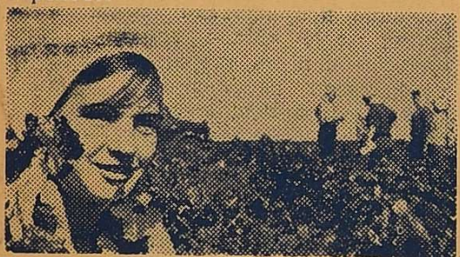
НА РОБОТАХ В ПОЛІ.

І ось — знову Одеса. Здрастуй, університет!