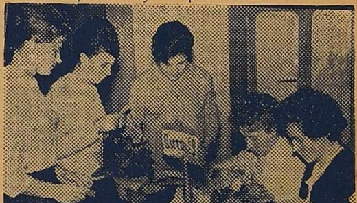
ВИБОРЦІ ОТРИМУЮТЬ БЮЛЕТНІ.

К ІНЕЦЬ грудня. Напружені дні. Розпочинається сесія. Вона крокує по факультетах. Сесія сьогодні господарює в університеті.