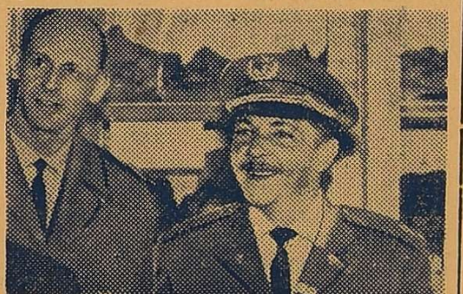
РАУЛЬ КАСТРО (справа) В ОДУ.

Д ВАДЦЯТЕ жовтня. Великий актовий зал університету заповнили комуністи. Вони прийшли сюди на звітно-виборчі партійні збори. Збори пройшли в діловій обстановці.