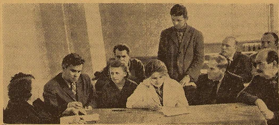
Партійна організація фізичного факультету всю свою діяльність буде так, щоб забезпечити високу успішність студентів, розвиток наукової думки й роботи.

НА ЗНІМКУ: ЗАСІДАННЯ ПАРТІЙНОГО БЮРО ФАКУЛЬТЕТУ.