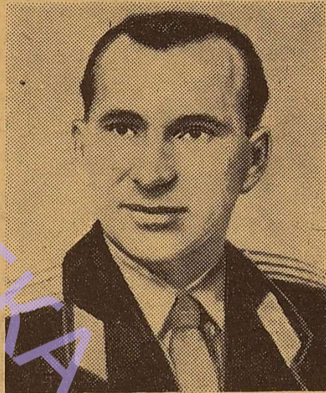
Командир корабля «Восход-2» льотчик-космонавт полковник ПАВЛО ІВАНОВИЧ БЕЛЯЄВ