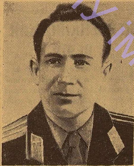
Другий пілот корабля «Восход-2» льотчик-космонавт підполковник ОЛЕКСІЙ АРХИПОВИЧ ЛЕОНОВ