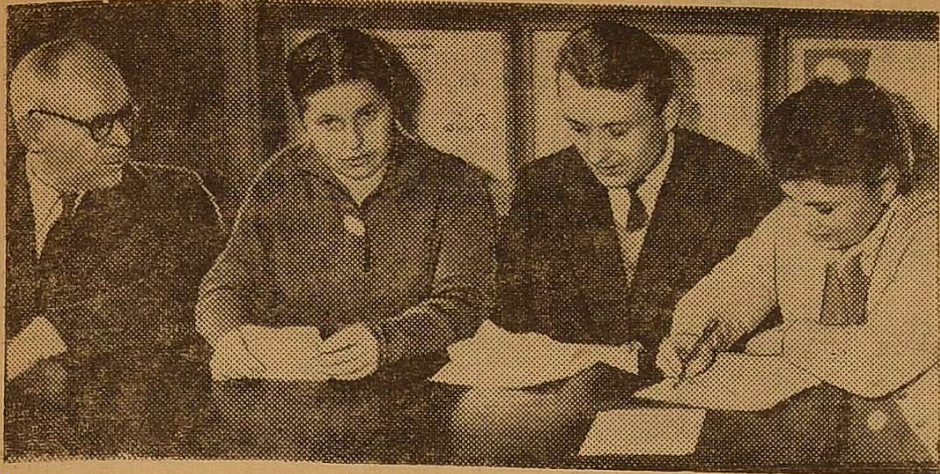
Члени університетської групи сприяння партійно-державному контролю обговорюють підсумки чергової перевірки.