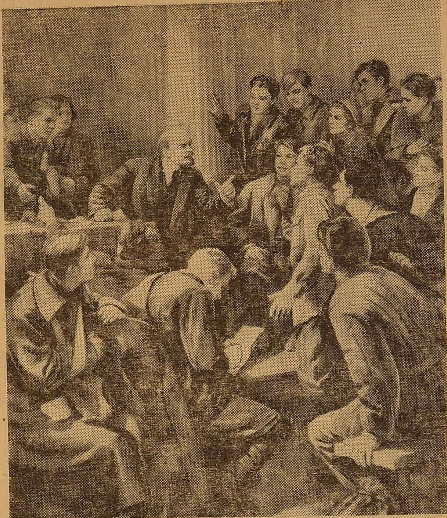
В. І. Ленін серед делегатів III з'їзду комсомолу. Картина художника П. П. Білоусова.