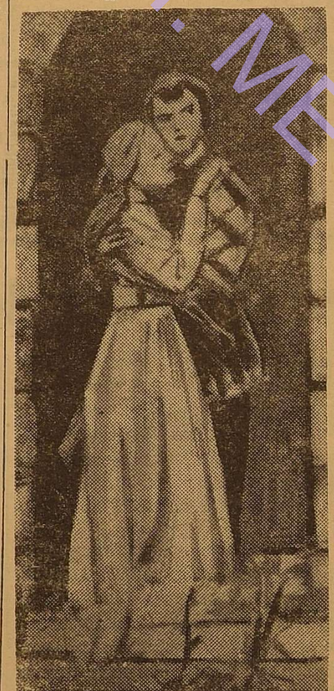
Ілюстрація художника Д. Шмарінова до трагедії В. Шекспіра «Ромео і Джульєта».