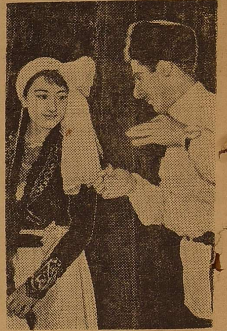
НА ФОТО: фрагменти з концерту художньої самодіяльності Тбіліського державного університету.