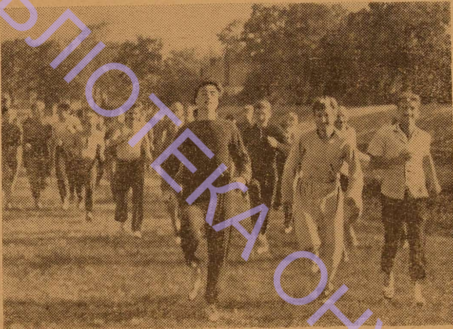
Легкоатлети тренуються на стадіоні ОДУ.