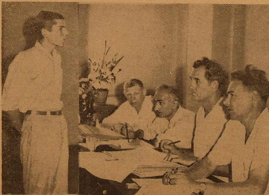
На фото: засідання приймальної комісії по зарахуванню студентів першого курсу.