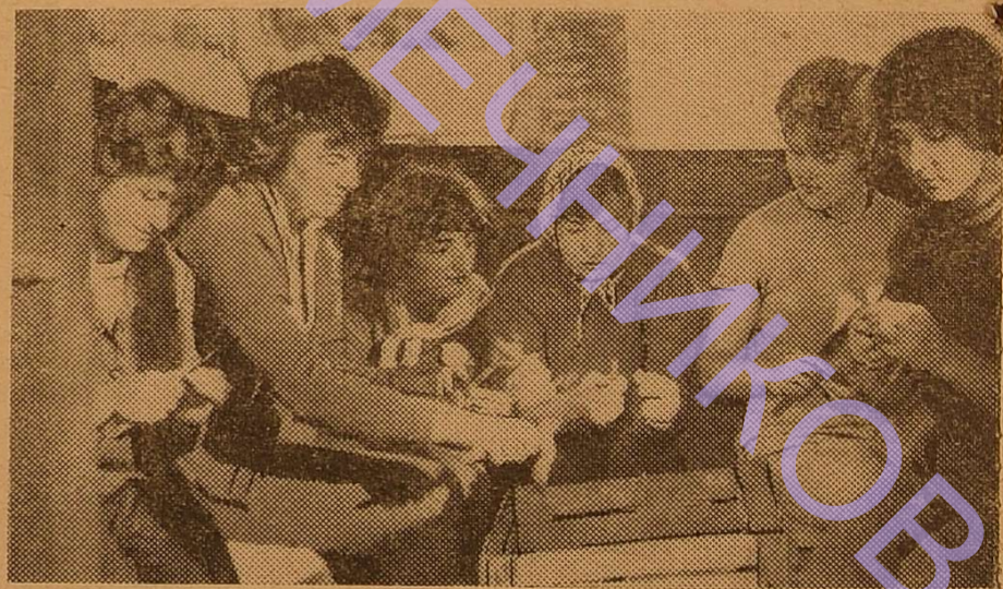
Самообслуговування — закон табірної життя.