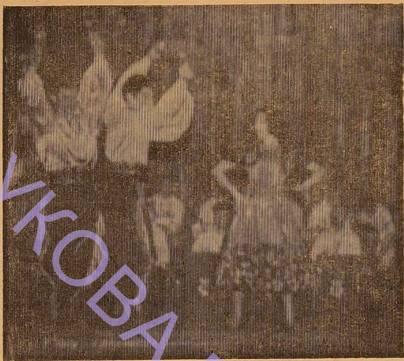
Танцювальний колектив університету виконує кубинський танець.