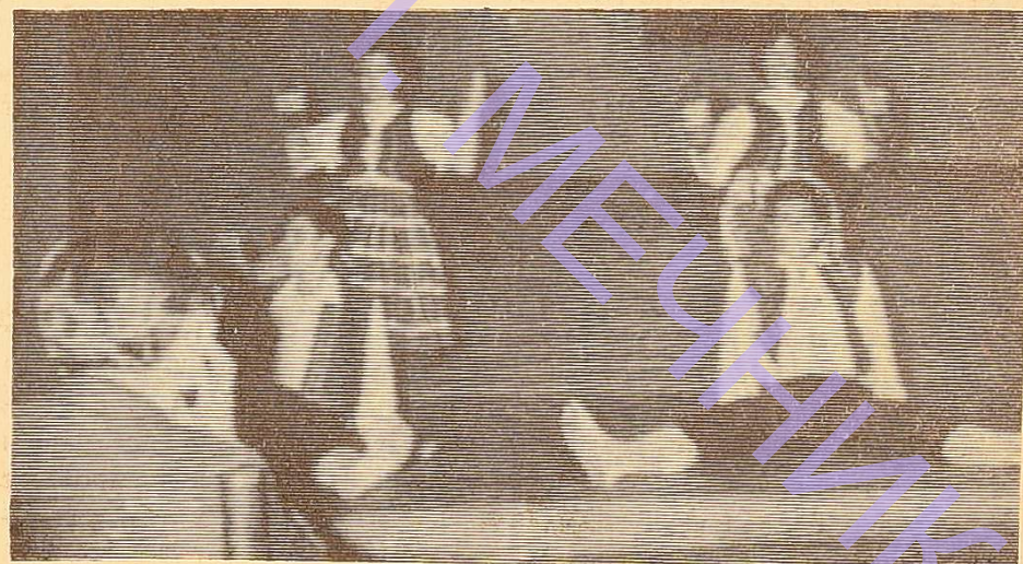
Виконується норвезький танець.

...Перші враження, перші знайомства. Чотири дні, проведені у Вільнюському університеті, — це