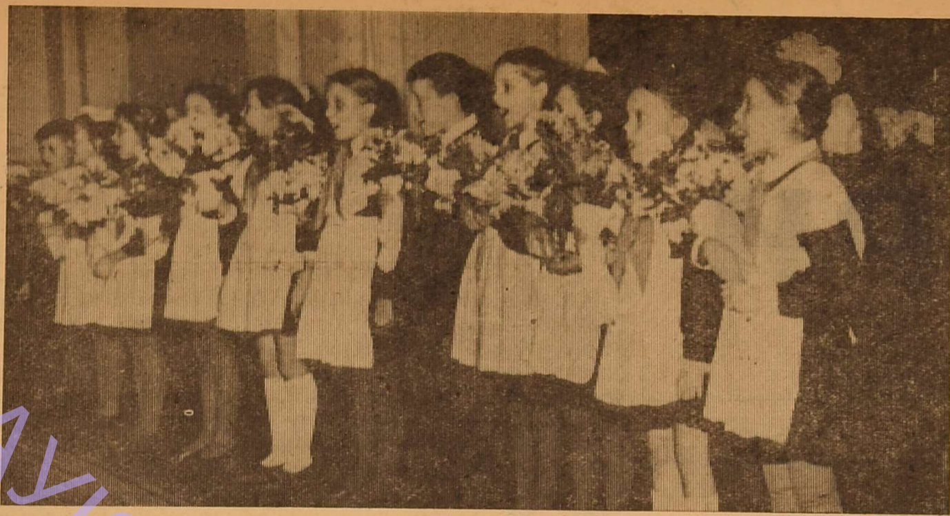
Підшефні вітають шефів.

на цій ділянці роботи комітету комсомолу є великі недоліки.