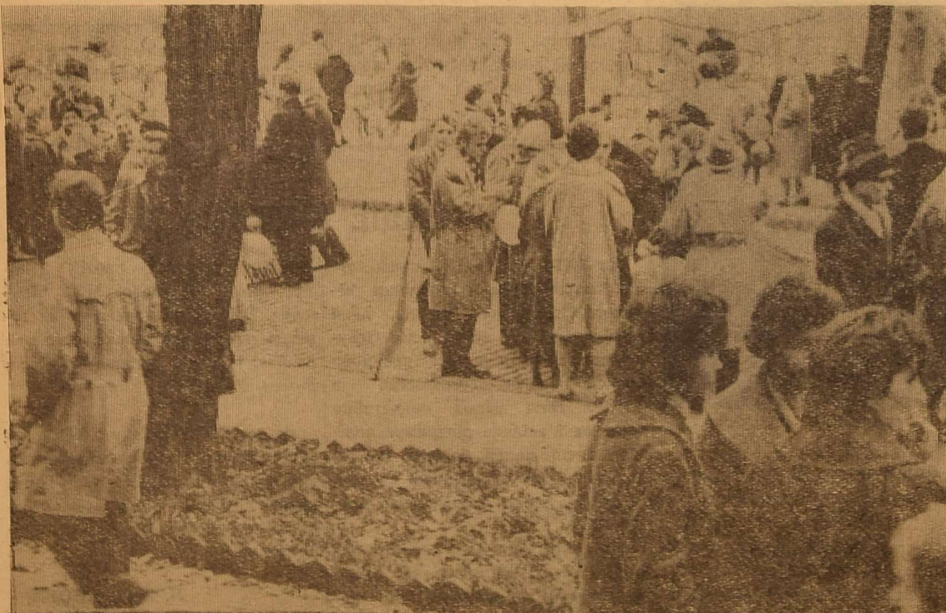
Ранок 7 листопада. Перед святковою демонстрацією.