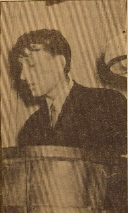
На трибуні — доповідач.

До речі, про ідеї. Члени комітету комсомолу звикли спускати ідеї зверху, не цікавлячись тим, що часто ці ідеї «знизу» не приймаються.