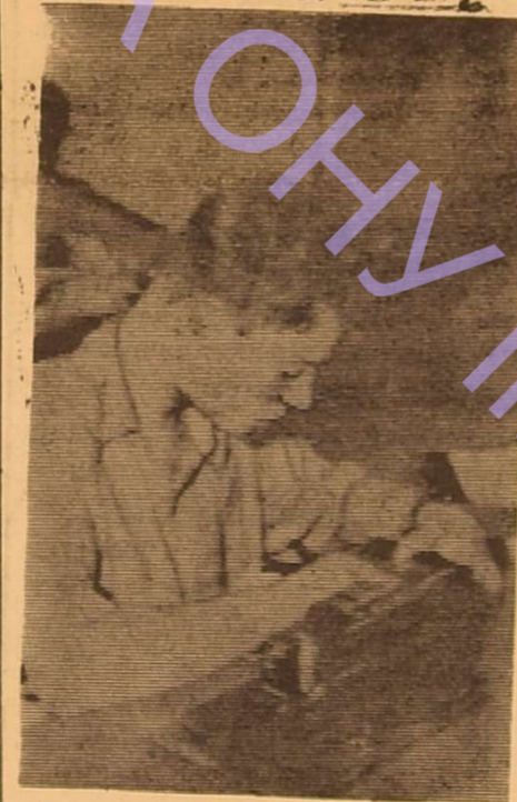
В кабінеті обчислювальної математики.