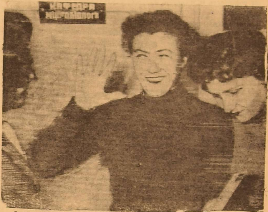
Оцінки говорять не лише про наслідок підготовки до екзамену, а й про настрої студентський.

Є. А. ТКАЧЕНКО, секретар деканату факультету.