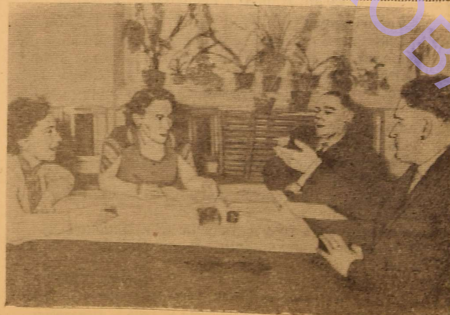
Під час перерви.

З великою увагою прослухали присутні повідомлення й інших учасників секції.