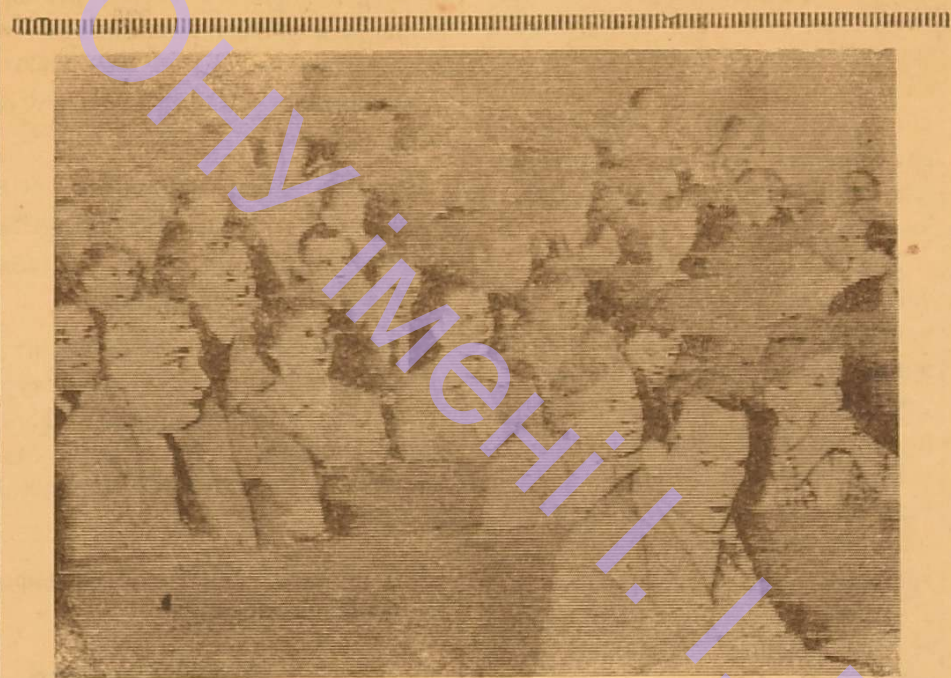
На секційному засіданні.

Було відзначено також і низку недоліків, усунення яких допоможе краще проводити подібні конференції. Очевидно, краще завчасно друкувати не лише тези доповідей, а повністю доповіді і розсилати їх учасникам конференції. Тоді робота конференції буде спрямована на обговорення основних питань.