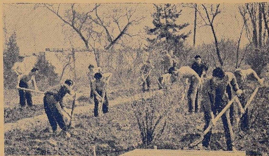
«Он, видно, труд считал за праздник, и так с тех пор у нас идет». Студенти університету на недільнику, присвяченому 90-річчю з дня народження В. І. Леніна.