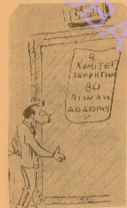
Картина, яку, на жаль, часто можна було спостерігати.

Ми зупинилися у своєму звіті про конференцію так детально на роботі комітету тому, що найменше критичних зауважень було саме в його адресу. Хай ці зауваження розвіють «блакитний туман».