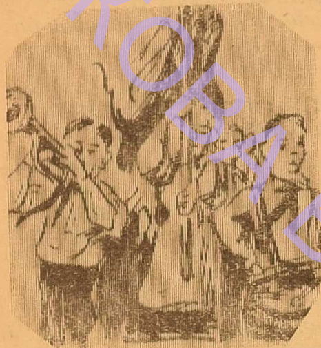
Конференцію прийшли вітати піонери...

Одеський університет Науки все постиг. Мова йшла, очевидно, про студентів. Студенти в залі зааплодували і засміялися. Мабуть, щось смішше згадали.