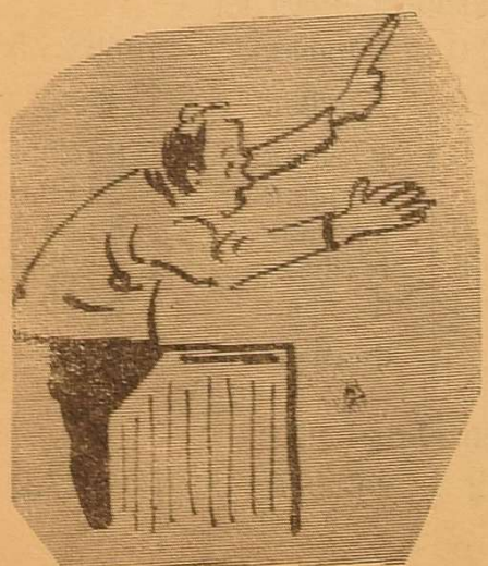
Оратор: «Дайте ще хоч одну хвилинку!».

Коли наша сім'я — найбільша, то, природно, що і справи наші