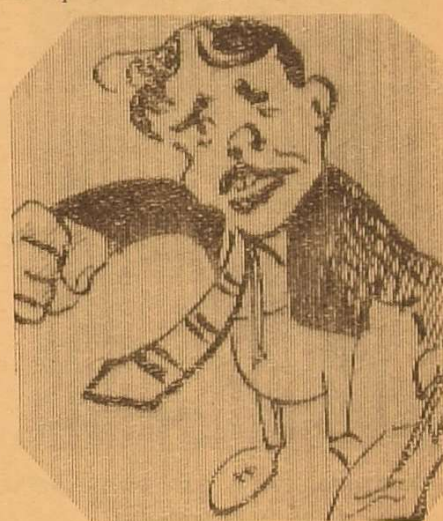
Принциповий критик: «От я критикував! Всю правду-матку врізав! П'ять анонімок до президії послав».

Чи ж справді не було у делегатів критичних зауважень?