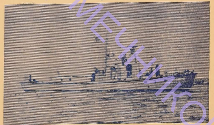
Науково-дослідне судно «Мечников».