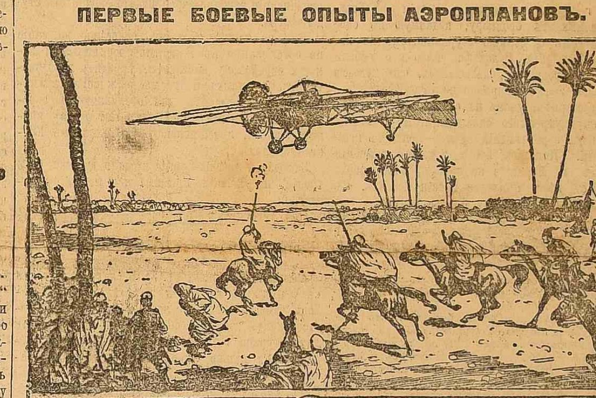
Вросаніи итальянцами бомбъ съ аэронавтовъ въ арабскій лагерь.