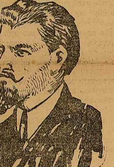
Нападникъ московскаго охраннаго отдѣленія полиціи. Фоль Котенка.