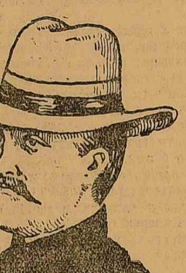
Нападникъ московскаго охраннаго отдѣленія полиціи. Фоль Котенка.