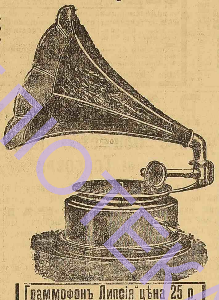
Граммофонъ Липсия цѣна 25 р.

Внутри Пассажа у меня магазина нѣтъ. По особымъ заказамъ выполняются скоро и аккуратно. Изящнейшие пататоны, синяки пѣсь высылаются бесплатно.