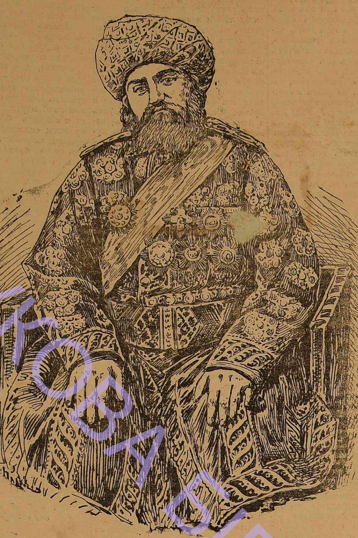
Эмир Бухарскій Сейид-Ахмед-Ахмедовъ.