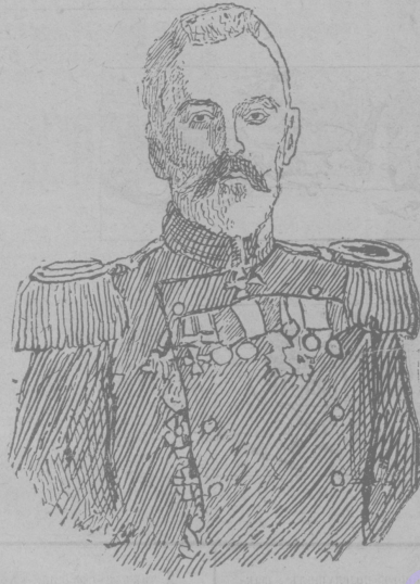
Командиръ порта въ Портъ-Артурѣ контръ-адмиралъ И. К. ГРИГОРОВИЧЪ.