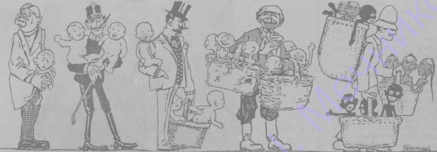
Германія. Австрія. Франція. Славонія. Европейскія колонія.